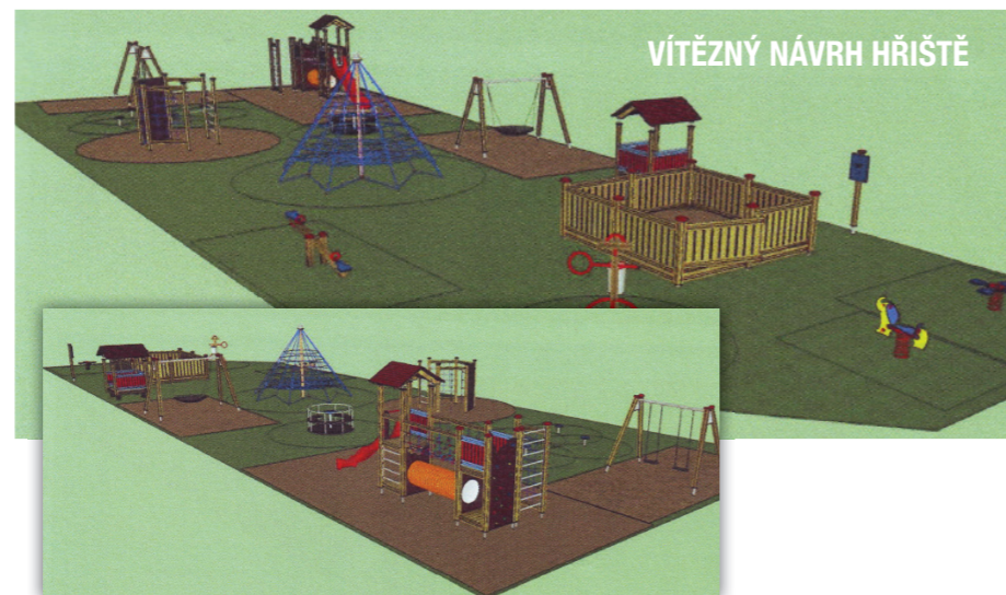
VÍTĚZNÝ NÁVRH HŘIŠTĚ

hřiště. V průběhu měsíce srpna dodavatel - firma LUNA PROGRESS - smontuje herní prvky, hřiště oplotí a připraví tak, aby mohlo být od září obcany plně využíváno.