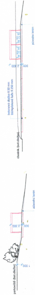
PODÉLNÝ ŘEZ - 1:200