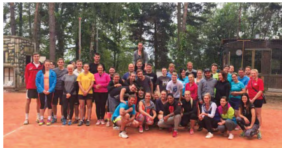
Účastníci jarního turnaje v plácané