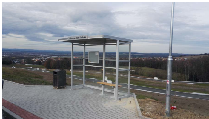
Po opravě Kodetka