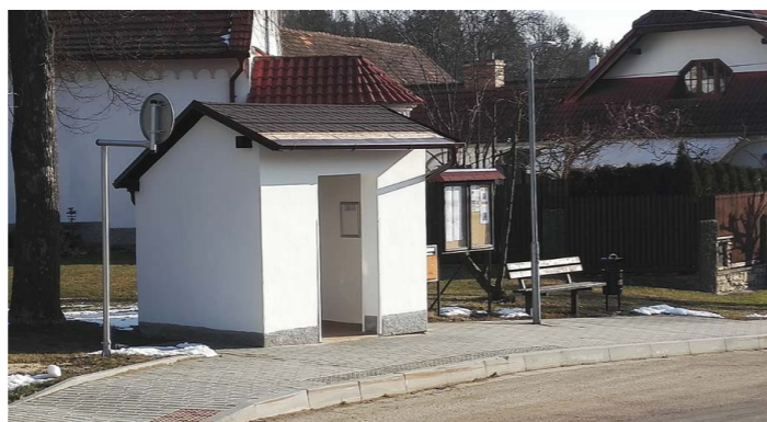
Po opravě návěs