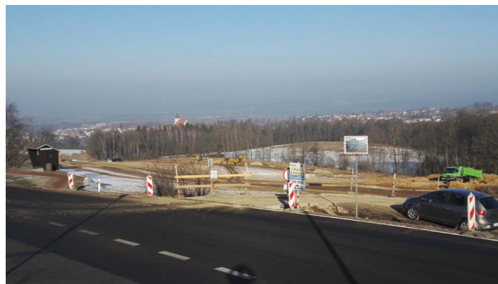
Před opravou Kodetka

v roce 2017 byla využita na opravu autobusových zastávek autobusů ČSAD v návěsním prostoru obce Hlincová Hora a na rozcestí obytných souborů 1 a 3 Hlincová Hora. Velmi důležitým momentem v poskytování těchto dotací je jejich správné vyúčtování, neboť v případě pochybení reálně hrozí vrácení všech financí. V současné době obec obdržela schválení vyúčtování dotace na úroky z úvěru a podle informací zbylé dvě dotace probíhají administrativním zpracováním a očekává se jejich potvrzení.