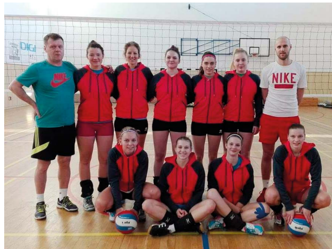
Foto ze soustředění před závěrečnou částí soutěže.

V kategorii žen bojujeme o udržení, v druhé nejvyšší soutěži republiky, v první lize. Družstvo má předpoklady dosahovat lepších výsledků. Problémem je, že hráčky jsou přes týden na vysokých školách Plzni, Brně, Praze a Liberci a z toho důvodu chybí možnost společného trénování více než jednou týdně. Další informace je možné získat na www.skhlincovka.cz .