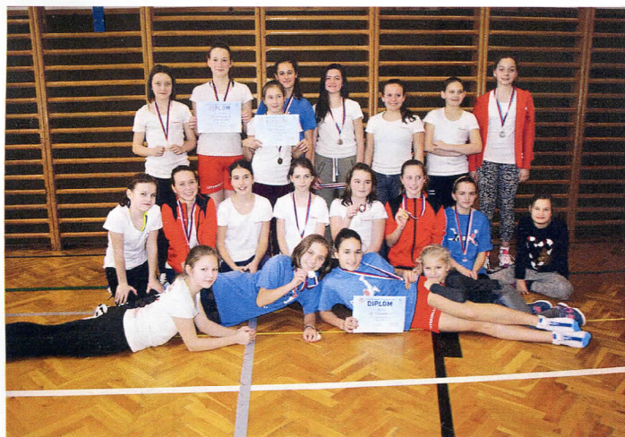
Děvčata do věku třinácti let, v přípravě na šestkový volejbal, se v krajské soutěži trojic umístila na prvních třech místech a čtvrté nasazené družstvo bylo šesté.

K výslednosti klubu v první čtvrtině nového roku. Je radostné konstatovat, že jsou ženy v 2. lize ČVS se značným náskokem první